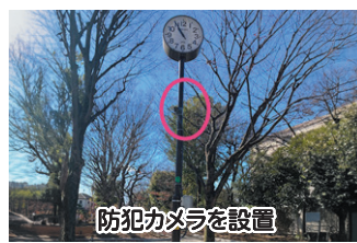
防犯カメラを設置