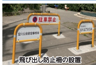
飛び出し防止柵の設置