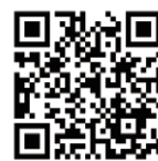
緊急要望の動画 令和5年12月7日