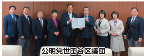
公明党世田谷区議団