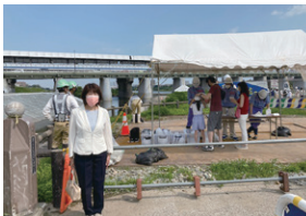
令和3年7月 二子玉川堤防整備の 現地説明会参加