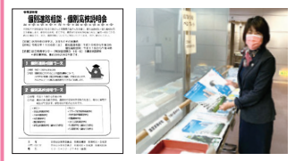
区立教育センターでの進路相談会