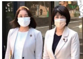
令和3年10月 竹谷とし子参議院議員と 「もみじの家」視察