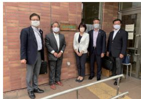
令和3年8月 調布市不登校特例校 分教室視察