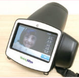
屈折検査機器 (スポットビジョン)

視力は、6～8歳で完成するため、3歳児健診で弱視の早期発見、早期治療が重要です。 世田谷区では、弱視の子どもの見逃されていることを指摘し、早期発見につながる屈折検査機器の導入を実現致しました。